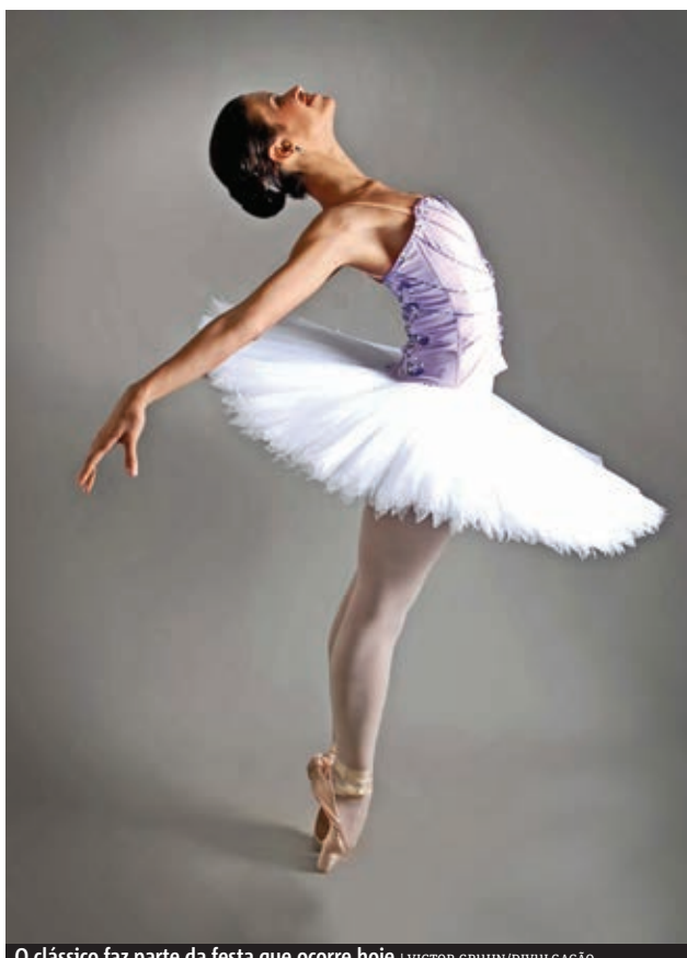
O clássico faz parte da festa que ocorre hoje